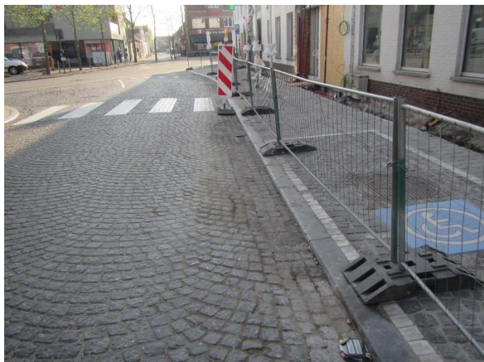
Momenteel opbraak voetpad voor plaatsing kunstwerk t.h.v. de elektriciteitskabine.