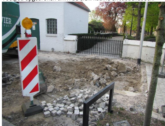
De aannemer moet steeds de afgeleverde signalisatiemachtiging van de gemeente opvolgen en dus de signalisatie in stand houden.