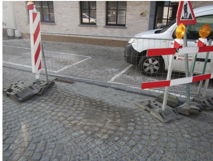
Voetpad opgebroken t.h.v. de elek. kabine en Jabbekebeek.